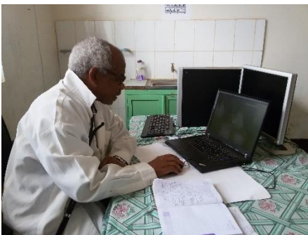
Læge ved computer